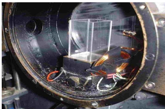
Geöffneter Photoelektronenvervielfacher mit Magnetspule und homöopathischen Globuli in einem Glasbehälter

Spannung von 50 Volt zusätzlich einem Magnetfeld mit spezifischen Frequenzen zum Beispiel von 2.06 Megahertz ausgesetzt. Anschliessend wurde jeweils die Abstrahlung von Photonen gemessen.